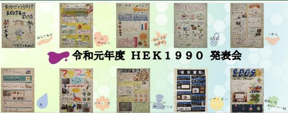
令和元年度 HEK1990 発表会

●お知らせ● HEK1990報告 昨年度より始まりました峰栄会人材育成制度HEK1990。2月1日に全36チームの中から10チーム選抜で、ポスターセッションによる発表会を開催。初めての取組でしたが、実りある発表会となりました。選抜10チームには、ポスターセッションで使用したポスターをプリントしたマグカップが進呈されました。