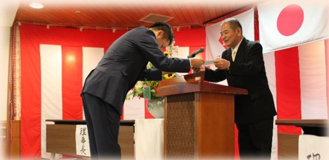
友志会様 さぎの宮寮 屋上の清掃など施設整備及び環境整備。