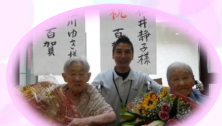
相談員と3ショット